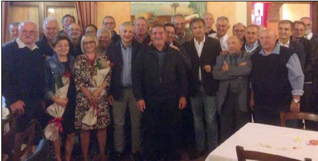
Agriturismo La Gasparina: un ricordo della classe 1956.