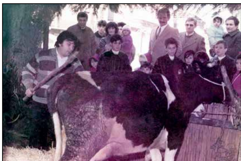
Una realizzazione Natale 1984, presepio vivente vicino al sagrato della Chiesa di Montichiari.

Gli incontri si terranno presso il Centro Diurno Casa Bianca in via Guerzoni 18 a partire dalle ore 15. Ingresso libero.