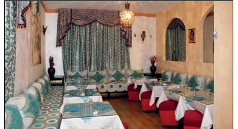
NUOVA SALA RINNOVATA PER APPUNTAMENTI

MENU' ALLA CARTA PIATTI DELLA CUCINA SIRIANA VINO BIANCO-ROSSO-BIRRA-GRAPPA SIRIANI