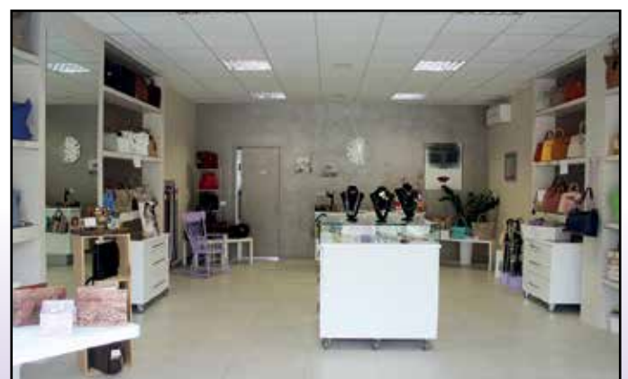
Il negozio di Madame Coco a Montichiari dopo la Farmacia Comunale.