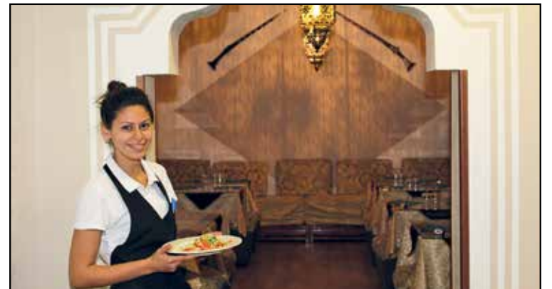
L'INVITO AD ENTRARE NELLA PRIMA SALA

APERTO da Lunedì a Domenica SOLO SERA 18,30 - 24,00 chiusura cucina ore 23